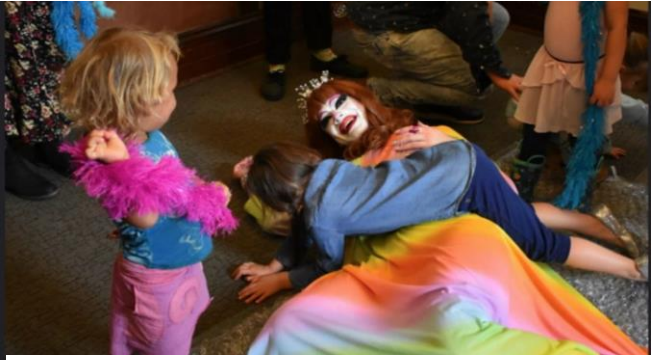
¿Esta travesti permite a los niños arrastrarse sobre él?